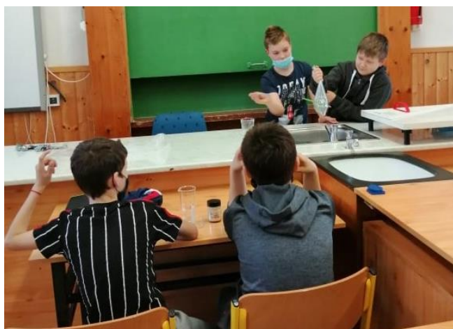
„Ceruzák a zacskóban”