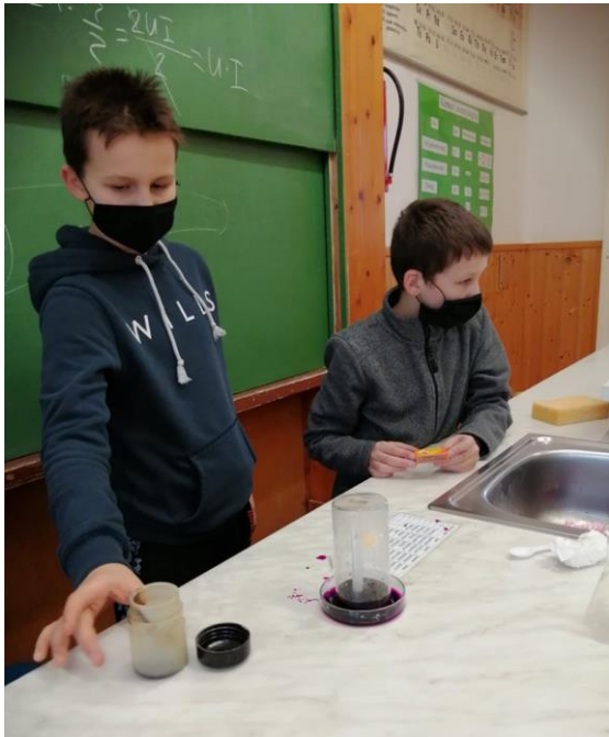
„Gyertya az üveg pohárban”